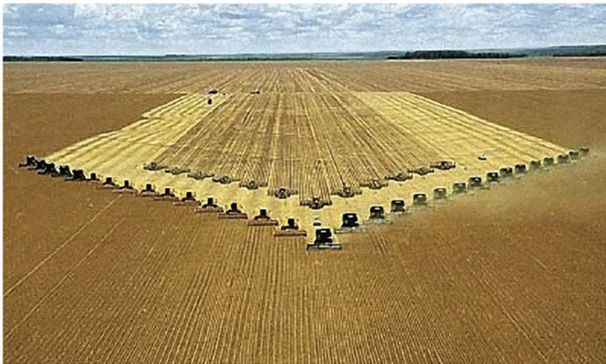
Colheitadeiras e plantadeiras no Cerrado

Adaptado de MATOS, Patrícia F. e PESSOA, Vera L. S. “ A modernização da agricultura no Brasil ”. GeoUERJ. 2011.