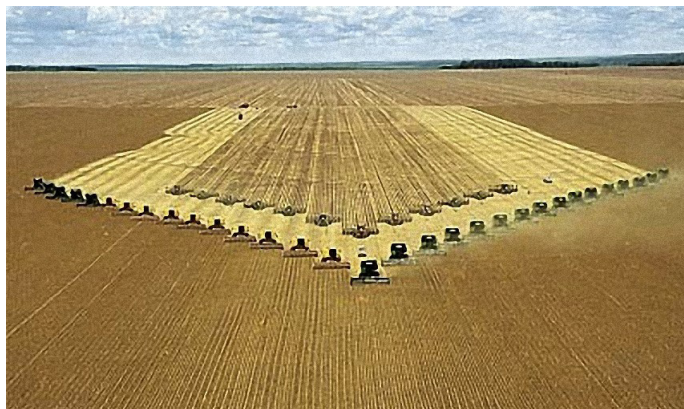
Colheitadeiras e plantadeiras no Cerrado http://boletimde.c.presscdn.com/wp-content/uploads/2015/08/colheitadeiras-plantadeiras-cerrado.jpg

Adaptado de MATOS, Patrícia F. e PESSOA, Vera L. S. “A modernização da agricultura no Brasil”. GeoUERJ. 2011.